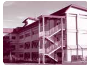
◀トイレの悪臭に何年も悩まされ、倒壊の危険により使用できない外階段など、緊急性の高い修繕箇所を抱えている高松小学校

市公共施設保有最適化・長寿命化実施計画に基づいて大規模改修を行う予定でいながら、労務単価の高騰などで計画額と実際の設計額に差額が生じたため、改修が先送りされている学校が相次いでいます。学校全体の老朽化の対策として改修を実施する予定も遅々として進まず、雨漏りやトイレの悪臭に悩まされ、修繕待ったなしの小中学校が散見されている状況であります。緊急度や優先度が高い箇所については、施設修繕を担当する職員が部分的に修繕をするなど対応にあたっている