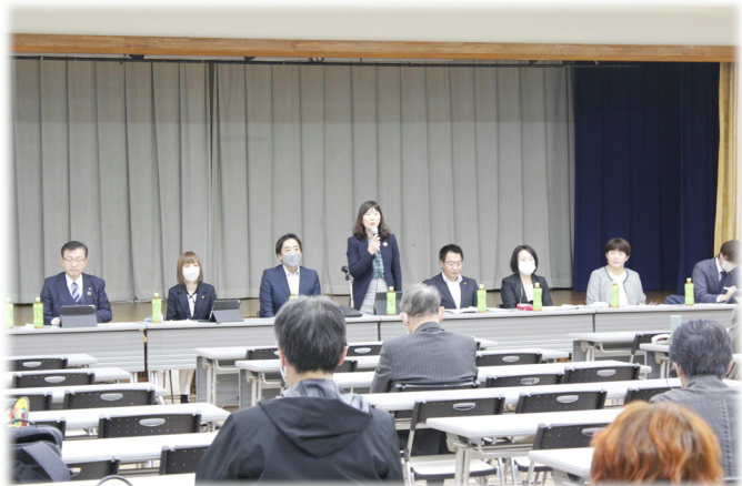
私立保育園 園長会 様との意見交換会 テーマ『人口減少と少子化について』